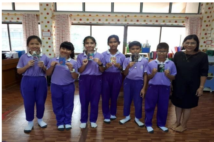
ภาพที่ 10 คุณครูประจำชั้นมอบรางวัลให้กับทีมที่ชนะในการเล่นเกมนิเวศความรู้

ผู้เขียนและนักเรียนร่วมกันแสดงความคิดเห็นและสรุปประโยชน์ที่ได้รับจากการจัดกิจกรรมในครั้งนี้ พร้อมประกาศผลและมอบรางวัลให้กับทีมที่ชนะในการเล่นเกมนิเวศความรู้ ดังภาพที่ 10