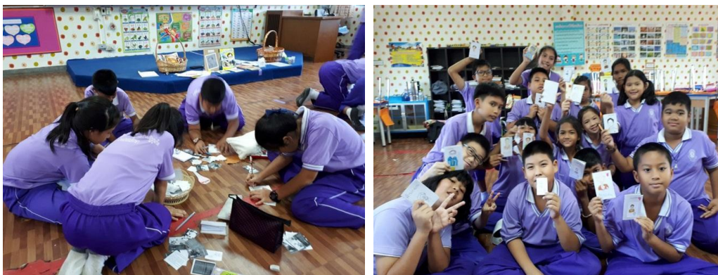
ภาพที่ 7-8 นักเรียนสร้างสรรค์สมุดทำมือคำพ่อสอน

3. สร้างสรรค์สมุดทำมือคำพ่อสอน โดยผู้เขียนเตรียมวัสดุและอุปกรณ์สำหรับประดิษฐ์สมุดทำมือไว้ให้ แล้วให้นักเรียนสร้างสรรค์เป็นสมุดทำมือคำพ่อสอนของตัวเอง สิ่งที่กำหนดคือ ภายในสมุดจะต้องมี 9 คำพ่อสอนที่ได้จากการเรียนรู้ไปก่อนหน้าและมีเพิ่มเติมจากสื่อความรู้ที่เตรียมไว้ให้ และหน้าปกเป็นภาพวาดลายเส้นพระบรมสาทิสลักษณ์ของรัชกาลที่ 9 อาจตัดแปะจากภาพที่เตรียมให้หรือวาดขึ้นมาใหม่จากจินตนาการของนักเรียน ดังภาพที่ 7-9