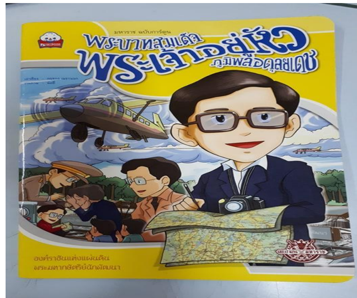
ภาพที่ 3 หนังสือพระราชประวัติพระบาทสมเด็จพระเจ้าอยู่หัวภูมิพลอดุลยเดช ฉบับการ์ตูน