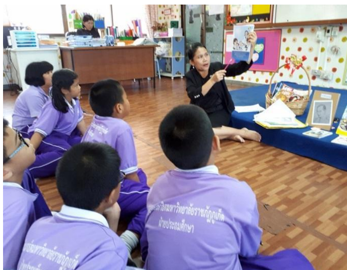
ภาพที่ 5 ผู้เขียนให้ความรู้เกี่ยวกับพระบรมราโชวาทและพระราชดำรัสในรัชกาลที่ 9 แก่นักเรียน

2. ให้ความรู้เกี่ยวกับพระบรมราโชวาท พระราชดำรัสในพระบาทสมเด็จพระปรมินทรมหาภูมิพลอดุลยเดช และเชื่อมโยงให้เห็นว่าพระบรมราโชวาทและพระราชดำรัสของพระองค์เป็นเสมือนคำสอนของพ่อที่ให้ไว้กับลูก ๆ ดังภาพที่ 5-6