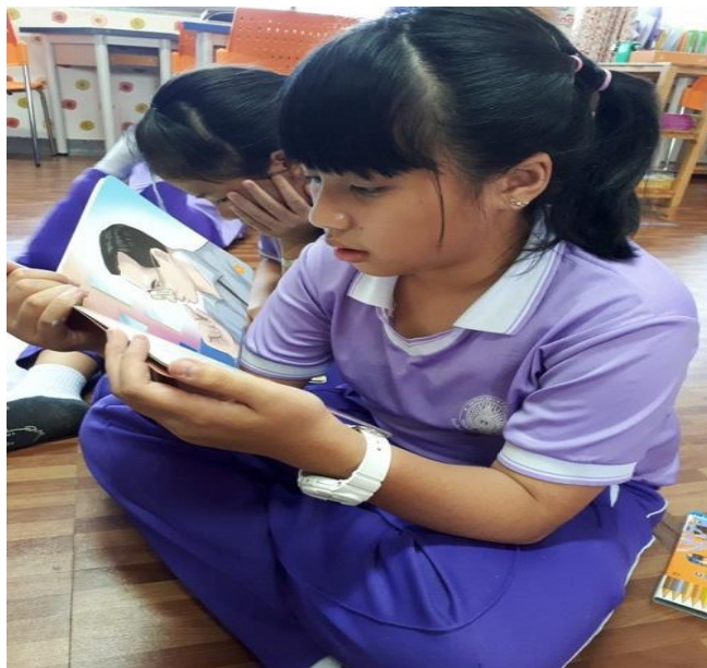
ภาพที่ 6 นักเรียนศึกษาความรู้จากหนังสือเกี่ยวกับรัชกาลที่ 9

3. สร้างสรรค์สมุดทำมือคำพ่อสอน โดยผู้เขียนเตรียมวัสดุและอุปกรณ์สำหรับประดิษฐ์สมุดทำมือไว้ให้ แล้วให้นักเรียนสร้างสรรค์เป็นสมุดทำมือคำพ่อสอนของตัวเอง สิ่งที่กำหนดคือ ภายในสมุดจะต้องมี 9 คำพ่อสอนที่ได้จากการเรียนรู้ไปก่อนหน้าและมีเพิ่มเติมจากสื่อความรู้ที่เตรียมไว้ให้ และหน้าปกเป็นภาพวาดลายเส้นพระบรมสาทิสลักษณ์ของรัชกาลที่ 9 อาจตัดแปะจากภาพที่เตรียมให้หรือวาดขึ้นมาใหม่จากจินตนาการของนักเรียน ดังภาพที่ 7-9