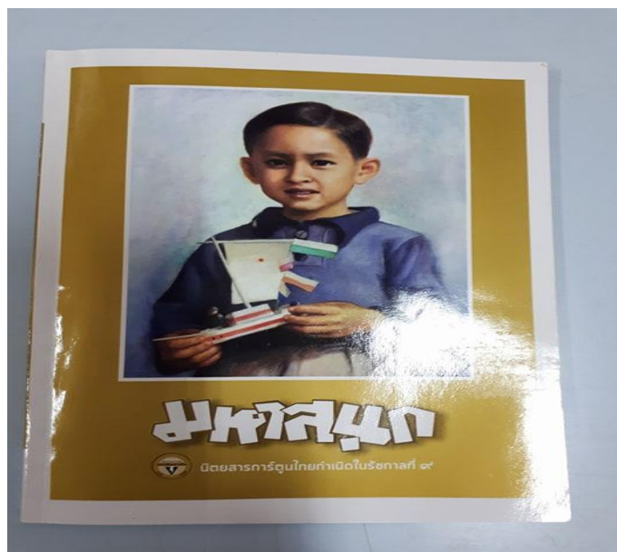
ภาพที่ 4 นิทรรศการการ์ตูนมหาสนุก ฉบับพิเศษ

2. ให้ความรู้เกี่ยวกับพระบรมราโชวาท พระราชดำรัสในพระบาทสมเด็จพระปรมินทรมหาภูมิพลอดุลยเดช และเชื่อมโยงให้เห็นว่าพระบรมราโชวาทและพระราชดำรัสของพระองค์เป็นเสมือนคำสอนของพ่อที่ให้ไว้กับลูก ๆ ดังภาพที่ 5-6