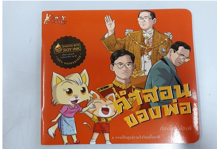
ภาพที่ 2 หนังสือคำสอนของพ่อ