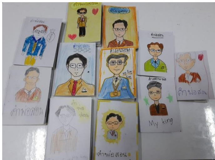
ภาพที่ 9 ผลงานสมุดทำมือคำพ่อสอนของนักเรียน